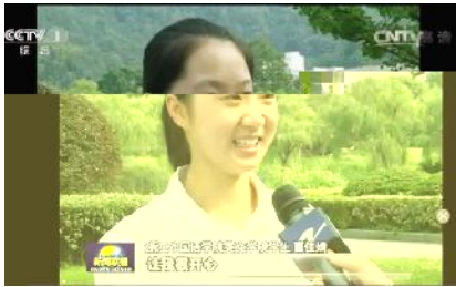
12 中 联

【编者按】2017年,学校深入推进“实践育人”工程,通过“走出去”和“请进来”相结合,开展各类志愿服务活动,提升学生实践能力,打造国际志愿服务“浙外”品牌。