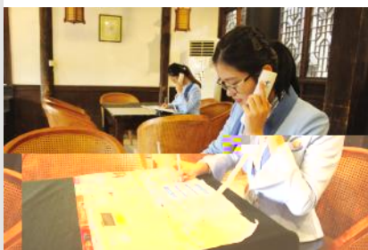
e6 桐 pq

2! 过系 规划 升 质C包括以社主义 核心价值现 奔> 理念O拓展>践 载 体O 制O人真做好 [ @菜=培训 pqO健全 保障体系O精力 [ w 牌C 丰富' 内@# n核 w 入实践 人全过程 为 FXO发F实践 人能 # 特6 实 通过开展k 愿经 业\ 能kI ^务P动AEFz Y进 : : P动 # n核 w 入k 愿^务 全过程 持& 4 O 实践 拓展 5实践 | .解~问题 方% &4 Ocl 发现问题 GI W视问题 G ' or\ 能解~ 实 问题 推动核 w 入 * 人 入实践 拓展' ZF 推动k 愿^实践 O89 发 F多6 科 b Y后 # $%i , 局 浙江 V~3pZCHI 有Yi` oJX[ HI 有Yi` : UV Cb k 愿^务实践 O 实践