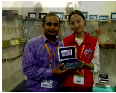
12 [ 义乌进口商 展

杭州峰B=世界互联网 B 性活动中Q 过 w12 T [ O 6展 e6j w Q = = 专<w pq 9 O W各 各