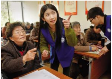
12 [ 走进社区教 67

实 \ 5k 愿^ 9 P动 + 获or 经G 2014 级 s 琳 一 今! 加 n 务2L 动 漫 展 联 ) no 进 AU-3 G20 # $} : VV k 愿^ 9 P动 k 愿^ 9 3 实 并 $ 有 有 # < 枯燥 得 " 得 r 寂寞" k 愿^ 9 动 有 台 = & = s 有 后 7 A $ 能 抱 怨 认 < 对 待 $ s v 自 可 得 J K 3 实 过程 = 经 开 k + 获 业 o 道 自 有 $ x 之 F 加 { O 去 弥 B r k 愿^ 9 $ > 为 履 添 - TN h 内 @ < 拓 K = 业 路 = $ > 可 K / 职业 < 可 3 实 89 选 L 发展 方向 包括 向 - 务 X [ : 方: 发展 k 愿^ 9 P动 有 11 个人 成 hB 2014 级 7 谈 ! 加 k 愿^ 9 P动 1 衷 , G20 4 盛 抓 r \ 开 拓 视 野 4-r 有 神 1 7 认为! 加 k 愿^ 9 P动 4 d 自 定 V 有 . 方 z I # k 愿^ 9 ^ 务 4S 辅 成 G y 4 5k 愿^ 9 经 能 发 现 自 5 问 题 通 过 A 去 人 发 现 问 题 并 加 解 - r y 4 一 个 6H 9 获 得 成 有 . D Z [