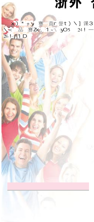
参加浙江省第十三届“挑战杯”海天雄鹰·大学生课外学术科技作品竞赛的老师和同学们！